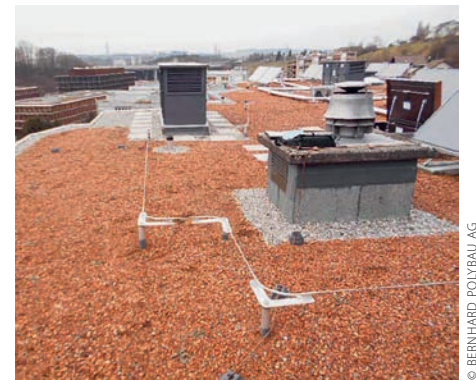
Frei überfahrbares Seilsystem.

Objekt Überbauung Kesslerweg, Ittigen Bauherr Credit Suisse Anlagestiftung, Zürich Architekt Ducksch Anliker Architekten AG, Langenthal Absturzsystem GREENLINE® von Grün GmbH, Wilnsdorf-Niederdielfen DE Verarbeiter Bernhard Polybau AG, Langenthal Mitglied Gebäudehülle Schweiz