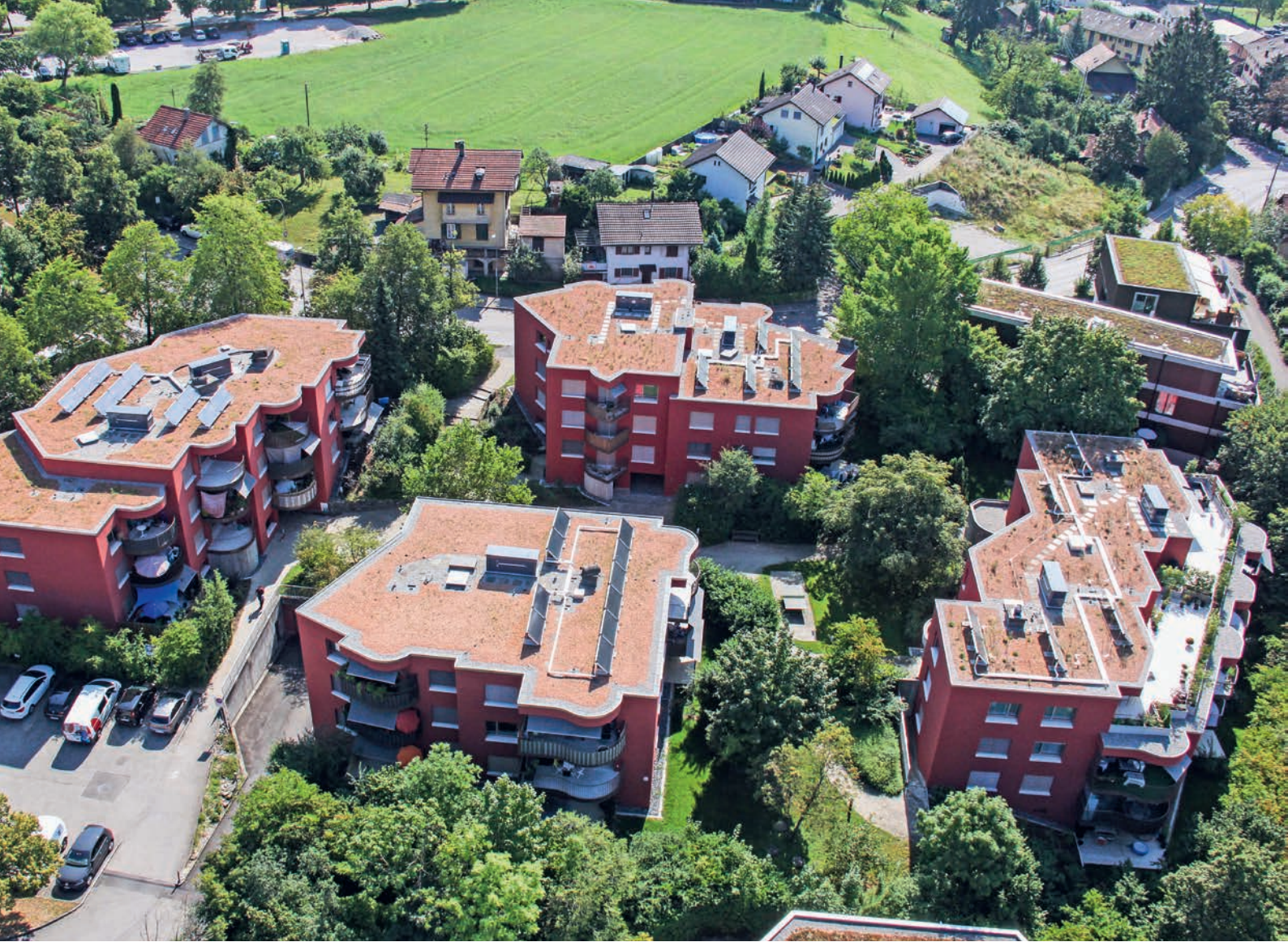
Sanierte Mehrfamilienhäuser in Ittigen bei Bern.